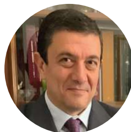
Prof. Alessandro Mechelli

“ Le tematiche relative al bilancio e al controllo di gestione sono intimamente collegate al concetto di sostenibilità. Tali strumenti possono aiutare le università a raggiungere questo obiettivo, fornendo informazioni utili per la pianificazione e l'implementazione di politiche e strategie sostenibili. ”