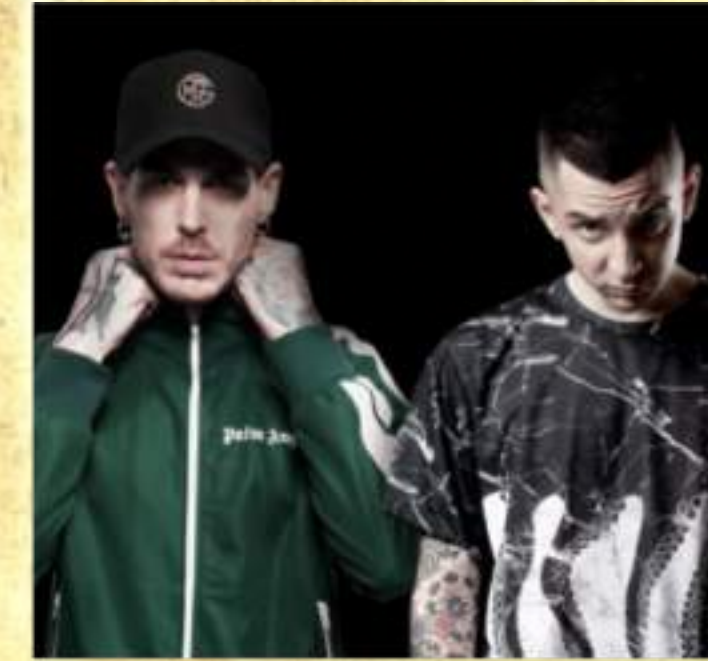
Geimitaiz (& Madmen)