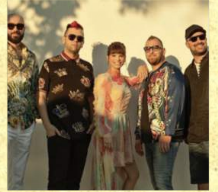
Boomda Bash / Alessandra Amoroso