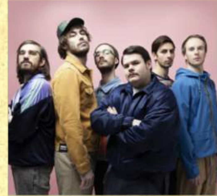
Pinguini Tattici Nucleari